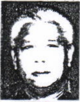
JAKARTA SELATAN 30-12-2011