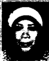
JAKARTA TIMUR 11-01-2012